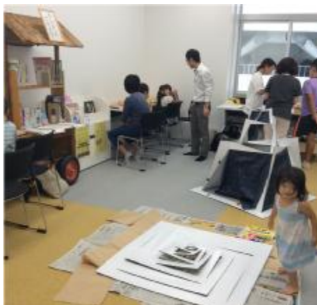
市内企業とのコラボイベントの様子

さらに10月1日には市内の中小企業を対象に経営に関する相談や具体的なサポートを行うビジネス支援機関「安城ビジネスコンシェルジュ（以下、ABC）」が図書館3階に開所し、市役所商工課の職員と民間のコーディネーターが常駐することとなった。プレオープンイベントで図書館の資料案内を行ったり、市内企業の商品開発のマーケティングを兼ねた子ども向けの工作イベントを協同で企画したりと、少しずつながら協力体制ができてくる。